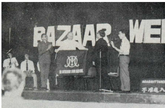
ワーヤンカレッジでの交歓会(1979年)

5月21日(月)から23日(水)、高校2年生の海外研修旅行(海外研修旅行という名称は1985年に初めて使用された)の訪問先として永年交流をしている香港のワーヤンカレッジ(九龍華仁書院)から生徒18名と先生2名の一行を受け入れました。同校からの生徒の受け入れは初めてです。