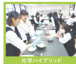
化学ハイブリッド