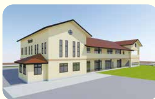
園庭側 外観イメージ

2024年4月、待望の金田東保育園(金田東こども園)新園舎の建築を実施する年度に入りました。現在園舎が建っている隣地に、ヴォーリス学園らしさ溢れる園舎を建てる予定です。設計監理を株式会社一粒社ヴォーリス建築事務所に委託し、建築の準備が着々と進められています。9月から3月にかけて建築工事を行い、2025年4月には新園舎にて金田東こども園としてスタートする予定です。皆様楽しみにお待ちください。