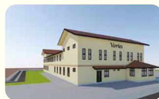
道路側 外観イメージ